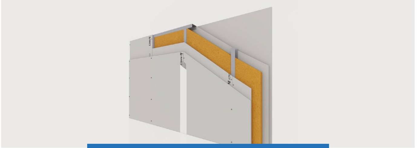
BÖLME DUVAR - TEK İSKELETLİ - ÇİFT KAT ALÇI PLAKA İLE

2,75 m YÜKSEKLİKTE 1 m 2 BÖLME DUVAR için %5 fire hesaba katılmıştır. Miktarlar yaklaşık olup proje detayına göre farklılık gösterebilir