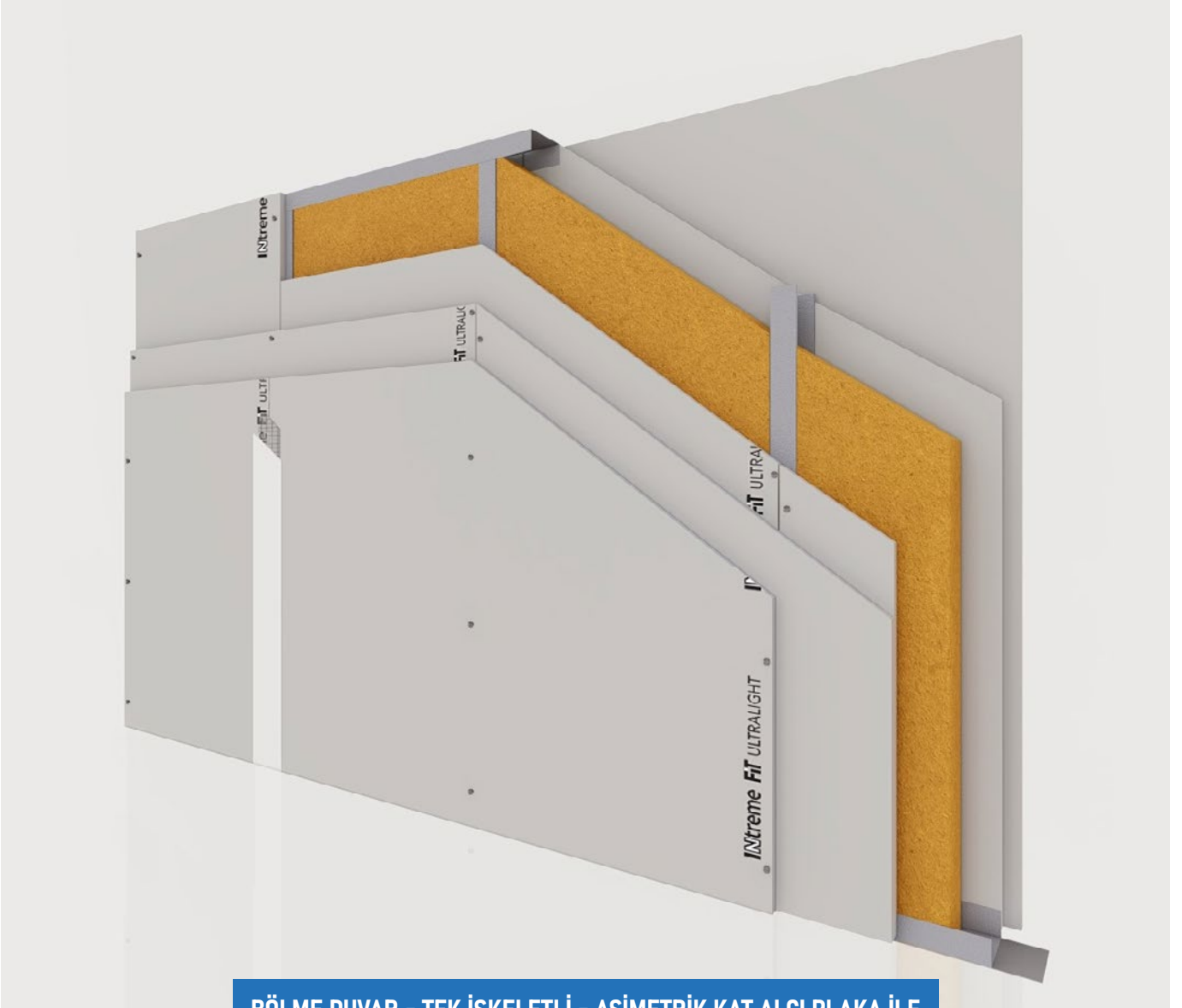
BÖLME DUVAR - TEK İSKELETLİ - ASİMETRİK KAT ALÇI PLAKA İLE